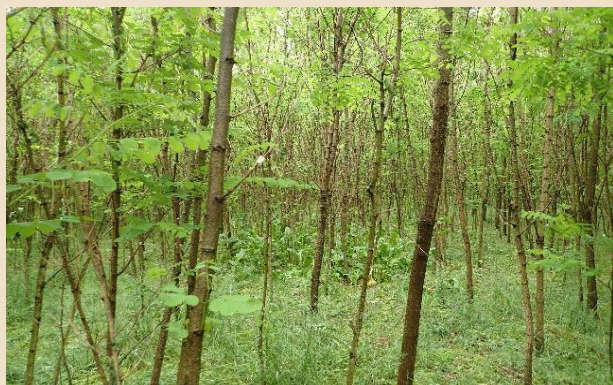
TCR de Robinier âgé de 5 ans – Bruno BORDE – CRPF Bourgogne-Franche-Comté ©CNPF

Les études menées font état d'une production moyenne de 8,5 tonnes MS/ha/an dans les meilleures situations sur des révolutions de 10 ans et de l'ordre de 6 tonnes MS/ha/an dans des situations moins favorables.